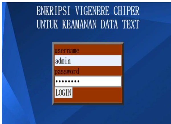
b. Tampilan Halaman Utama Sistem