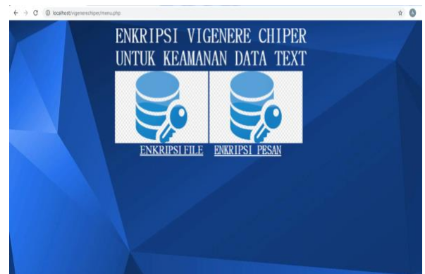
c. Tampilan Menu Proses Vigenere Cipher